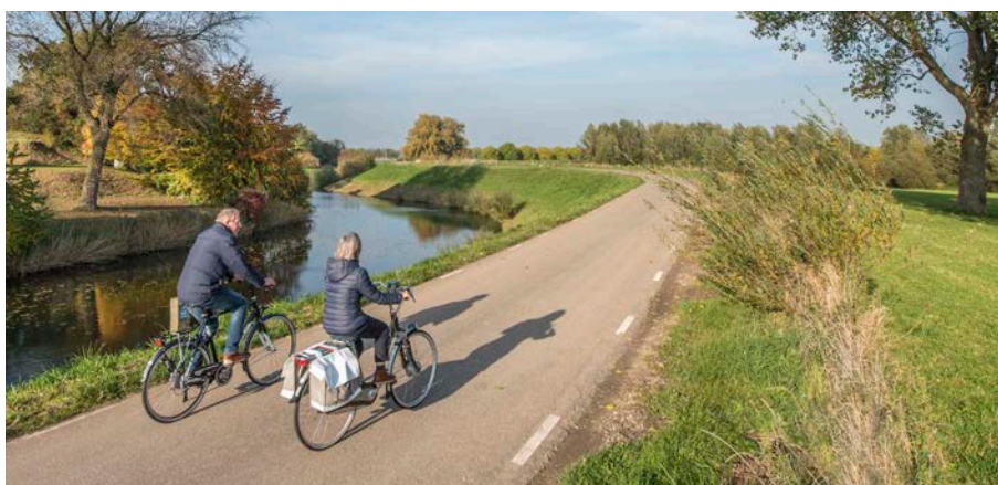
Ook de landschappelijke en recreatieve kwaliteit wordt meegenomen in de plannen.

realiseren zich wel dat er iets moet gebeuren, maar de individuele impact kan groot zijn en sterk verschillen. Omdat dit best emotioneel kan zijn, willen we dat we onze keuzes nu goed kunnen uitleggen en ook aandacht hebben voor de leefbaarheid." Nonnekens: "Aan het resultaat moet je straks in elk geval kunnen zien dat we naar elkaar hebben geluisterd. Mensen komen nu al met waardevolle input. Zoals in Vuren: door de vorige ronde, twintig jaar geleden, was het dorp eigenlijk afgesneden van de rivier. Dat hadden de bewoners toen graag anders gezien. Nu gaan we vooraf in gesprek. We hebben allerlei bouwstenen gekregen die de plannen beter en mooier kunnen maken. Denk aan wandelpaden of uitkijkpunten. Die zijn niet nodig voor de dijkveiligheid, maar wij kijken of we met