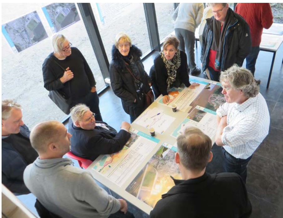
Omwonenden konden in 2017 al in een serie bijeenkomsten hun input leveren.